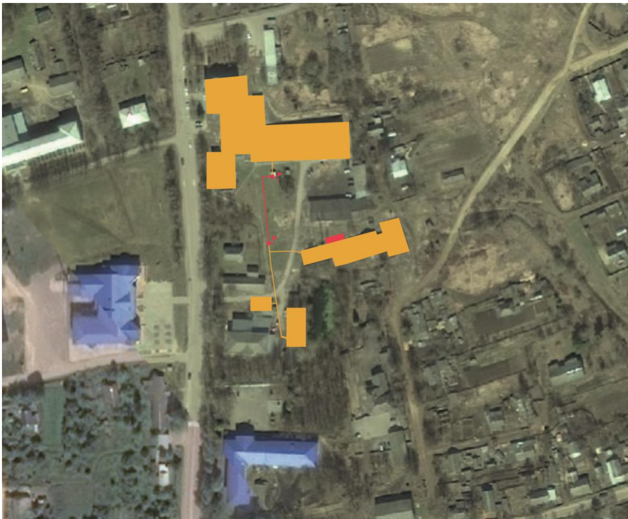
Рисунок 11.И - Имитации аварийных ситуаций

Например, при аварии произошло отключение теплоснабжения группы зданий с минимальным коэффициентом тепловой аккумуляции 40 при температуре наружного воздуха -30^{\circ}\text{C} . Соответственно, максимально допустимое время на ликвидацию аварии и восстановление теплоснабжения составляет 5,3 часа, при превышении указанного времени произойдет остывание внутренних помещений зданий ниже допустимого значения +12^{\circ}\text{C} .