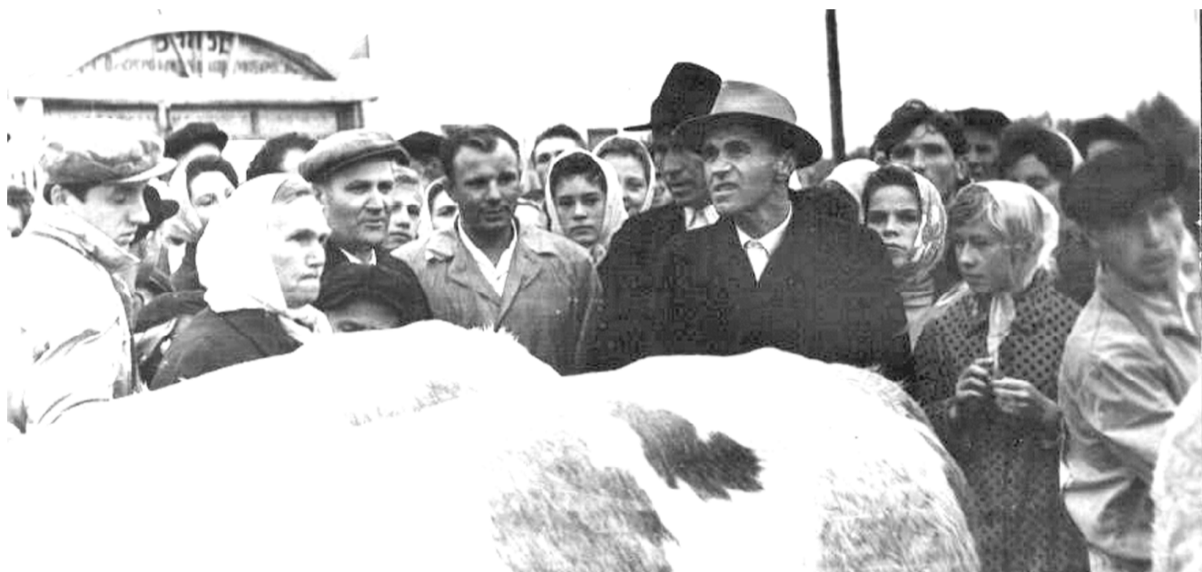
Ю.А. Гагарин в Сычевке на выставке местной породы скота. Фото 1964 года.

Было это в начале семидесятых. Я тогда еще в начальную школу ходила. Но дома, в деревне, нам важные дела доверяли – коров и овец с пастбища встретить, попать их на лугу немного и каждому свою скотину в сарай загнать.