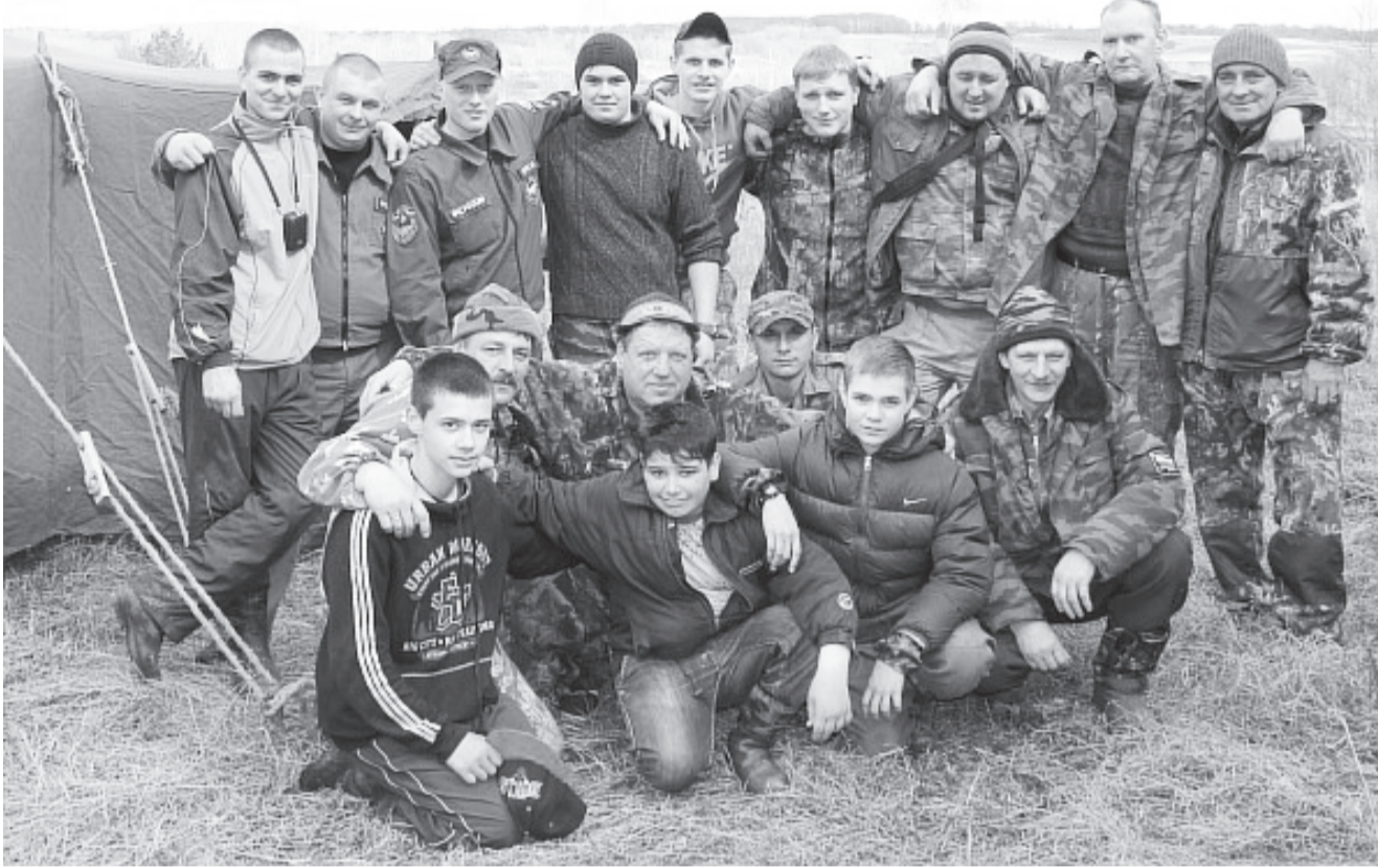
Бойцы поискового отряда «Гвардия» в период проведения одной из «Вахт Памяти». Снимок сделан до введения ограничительных противоэпидемиологических мер.

В этом году, 18 февраля, День поисковика в Смоленской области отметят впервые официально: в июне прошлого года Смоленская областная Дума утвердила праздник на уровне региона. Этот День – почитание иконы Божьей Матери Взыскания погибших, духовной покровительницы поисковиков, несущих свою Вахту Памяти на смоленской земле.