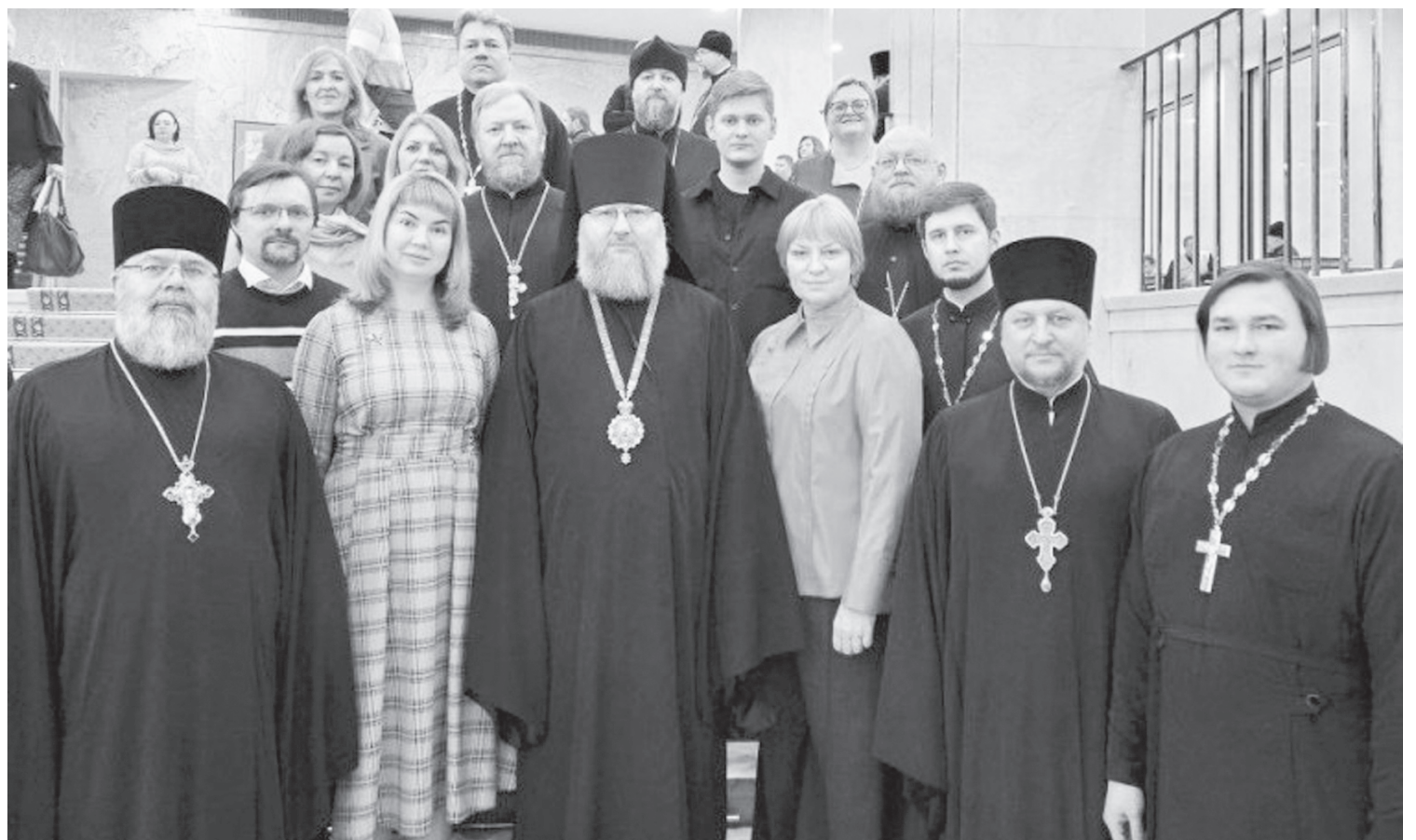
На снимке: смоленская делегация на Рождественских Чтениях в Москве.