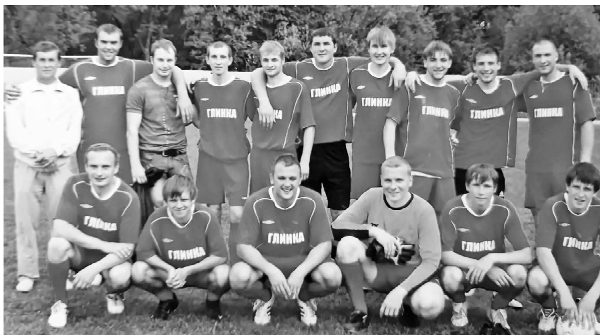
Глинковская футбольная команда.