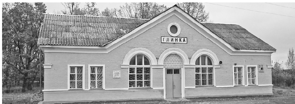
Станция Глинка. Железнодорожный вокзал.