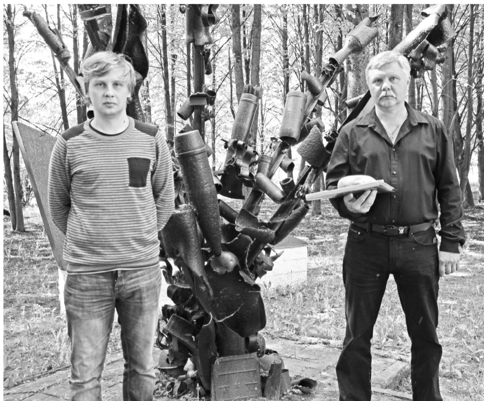
Родственники погибшего героя на Поле Памяти в деревне Яковлево. (Фото сделано до введения ограничительных противоковидных мер).