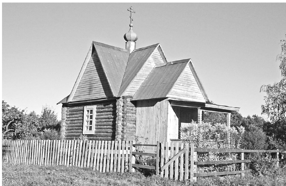
Церковь Казанской Божьей Матери. Деревня Ново-Яковлевици.