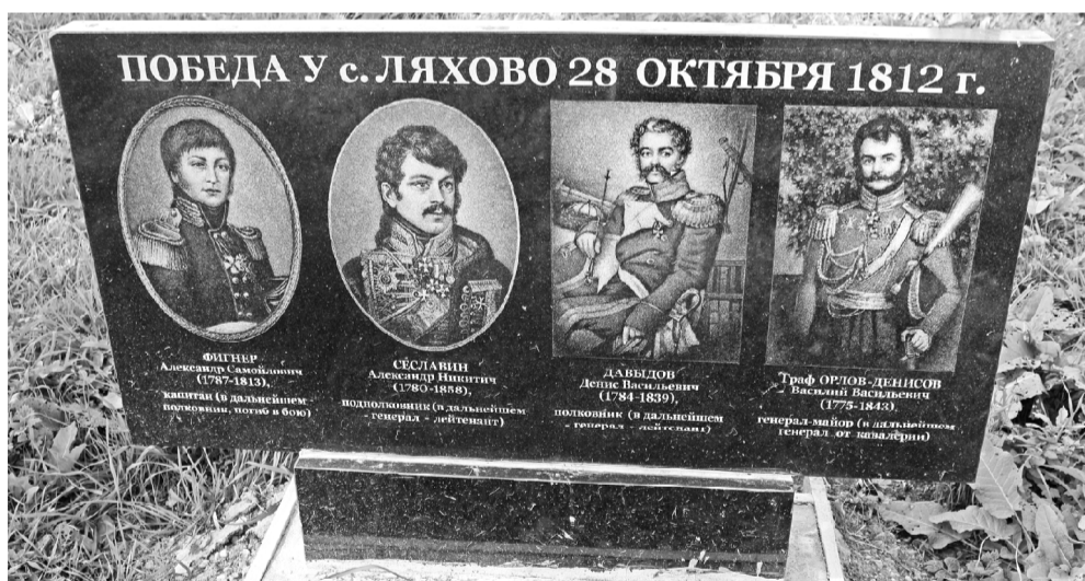
Мемориальная плита, установленная в честь победы русских войск над французами у деревни Ляхово.