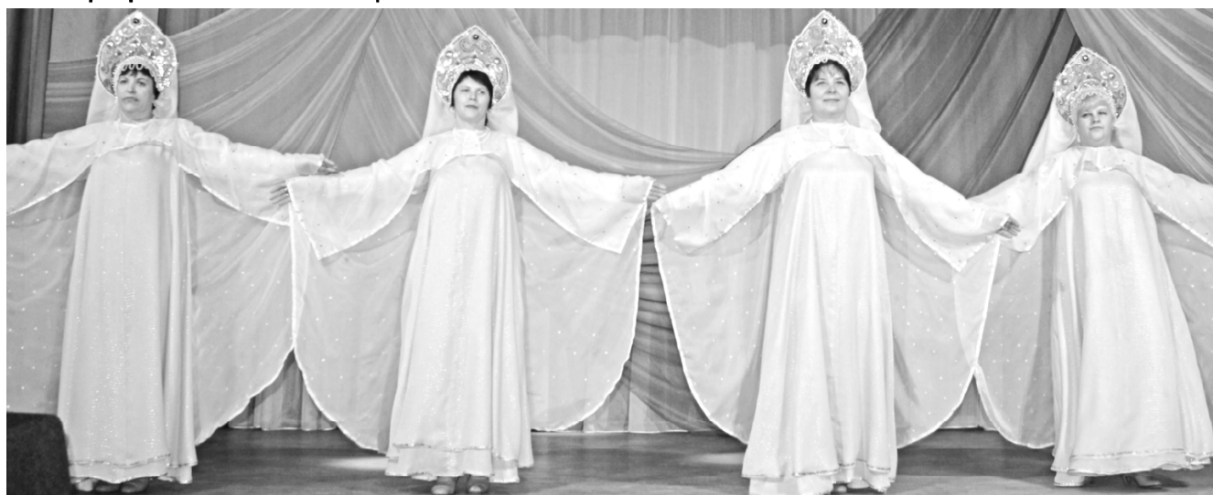
(Фото сделано до введения ограничительных противоковидных мер).

В этом году день народного единства для многих прошел в стенах собственного дома. Ничего не поделаешь, пандемия диктует свои условия. Вместо массовых торжеств по всей стране состоялось множество камерных мероприятий.