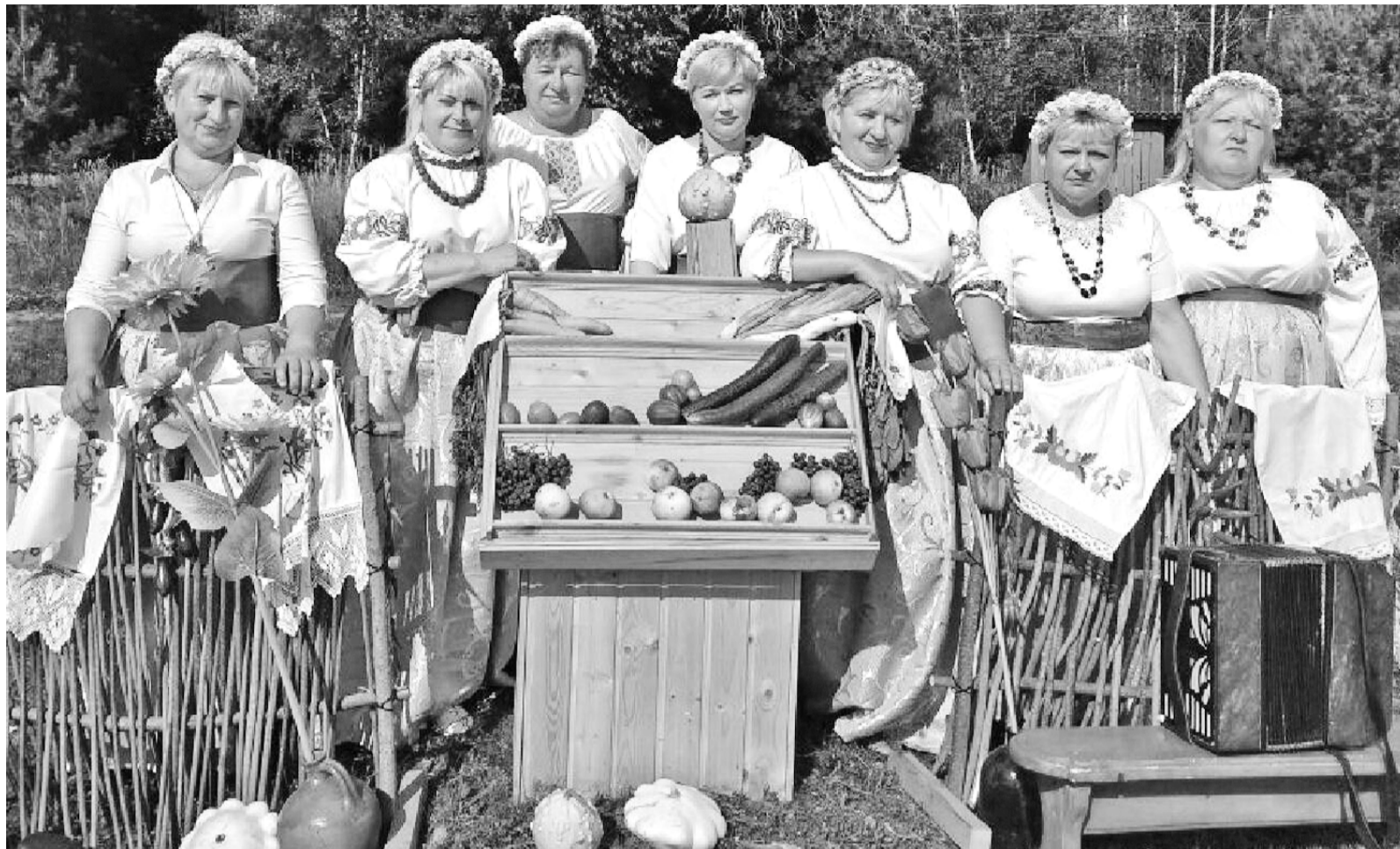
Участницы праздника, посвященного деревне Добромино.