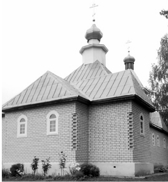
Храм Святителя Николая в Глинке.

В 2003 году один из жителей Глинковского района, местный художник, начал работу над иконой Божией Матери «Скоропослушница». Однако, по ряду причин, образ Пресвятой Богородицы с младенцем, написанный на холсте простым карандашом и гуашевыми красками, так и остался незаконченным. Через некоторое время на облачении Богоматери стали видны капельки маслянистой жидкости, похожей на миро. По свидетельству очевидцев, Лик Богоматери постепенно проявился с обратной сто-