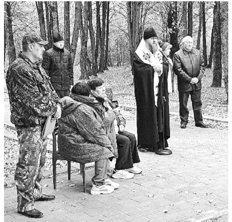
В ходе митинга в деревне Яковлево.

значит, что все усилия не напрасны, что память жива, и что в наших сердцах есть место Любви, Состраданию и Человечности.