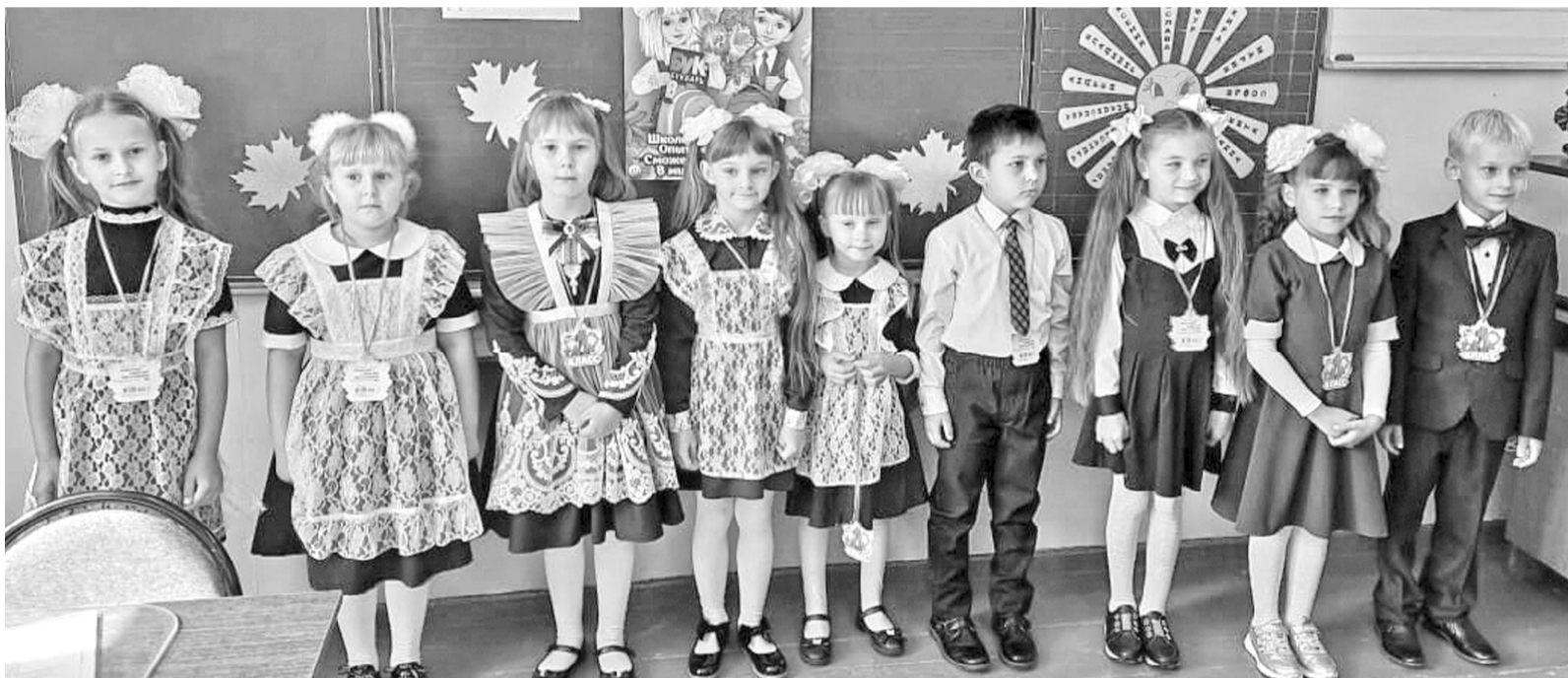
Первоклассники готовы к своему первому уроку.

Первого сентября во всех школах проходит торжественная линейка, посвящённая началу нового учебного года. Этот день ждут с нетерпением все ученики, но особенно это волнительный момент для самых маленьких – первоклашек. Ведь они вступают на первую ступень к открытию новой жизни, интересной, но с другой стороны, сложной и ответственной.