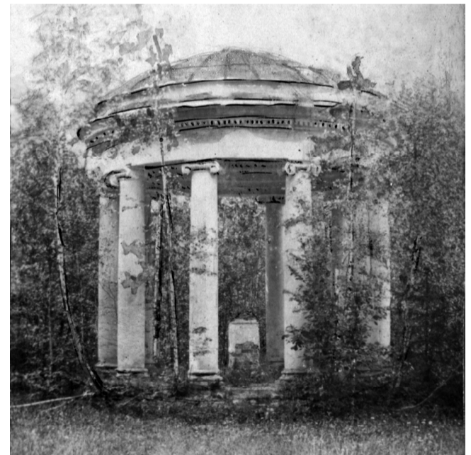
Разрушенная беседка в заглохшем Крашневском парке.