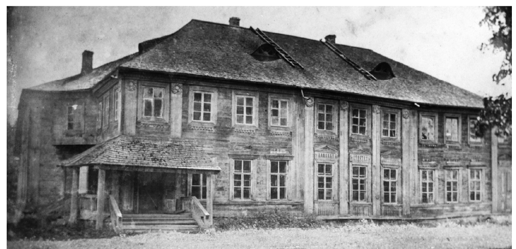
Ивонинский старый усадебный дом, выстроенный Елизаветой Федоровной Энгельгардт, дочерью Ф.Б. Пассека. Конец XIX в.