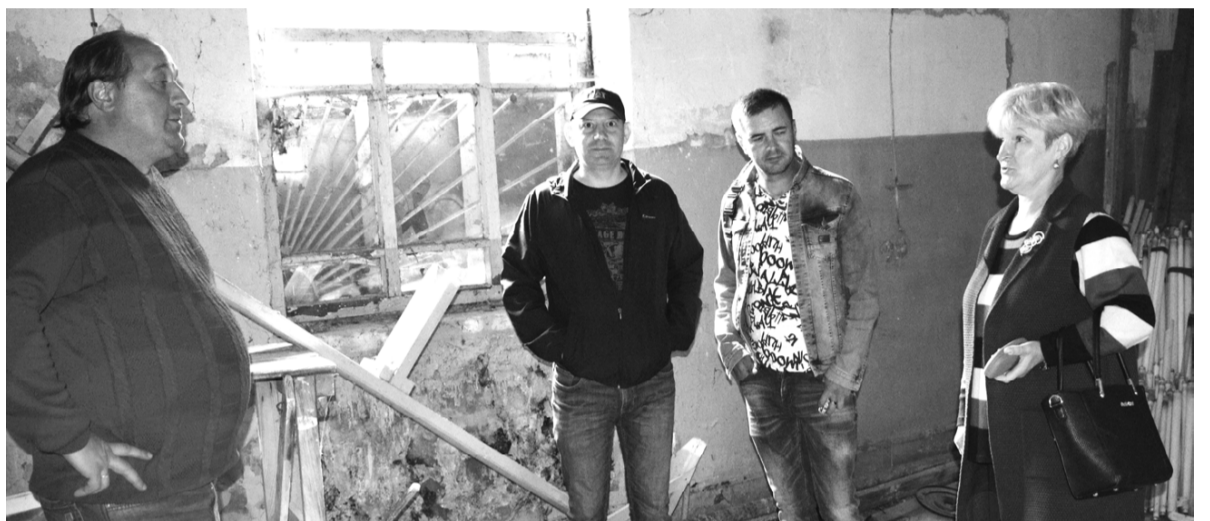
На будущем объекте обсуждают предстоящую реконструкцию.

В январе текущего года руководством Смоленской области было принято решение инициировать разработку комплекса мер, направленных на поддержку муниципалитетов с точки зрения строительства и реконструкции общественных бань.