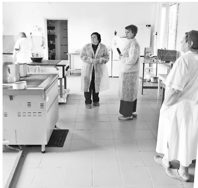
В ходе приемки пищеблока Глинковской средней школы.

– Да, до нового учебного года осталось совсем немного времени. Какие задачи вы считаете приоритетными в работе пед-