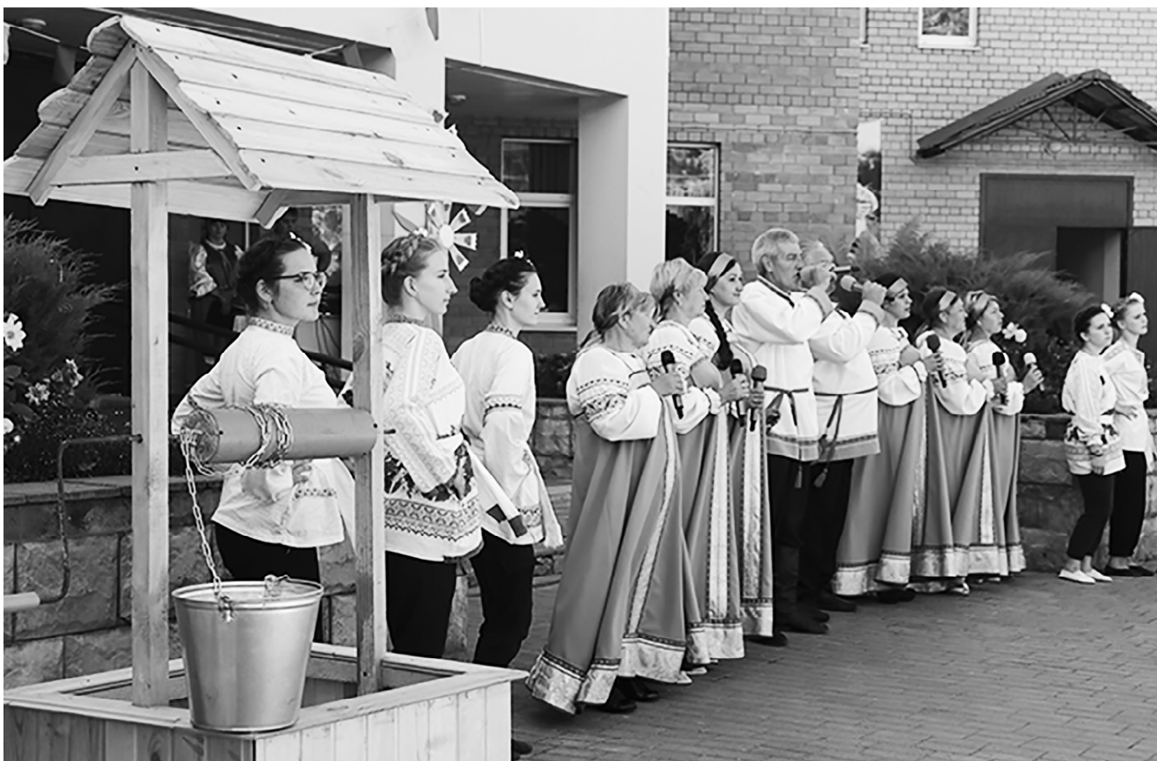
Коллектив Болтутинского сельского Дома культуры