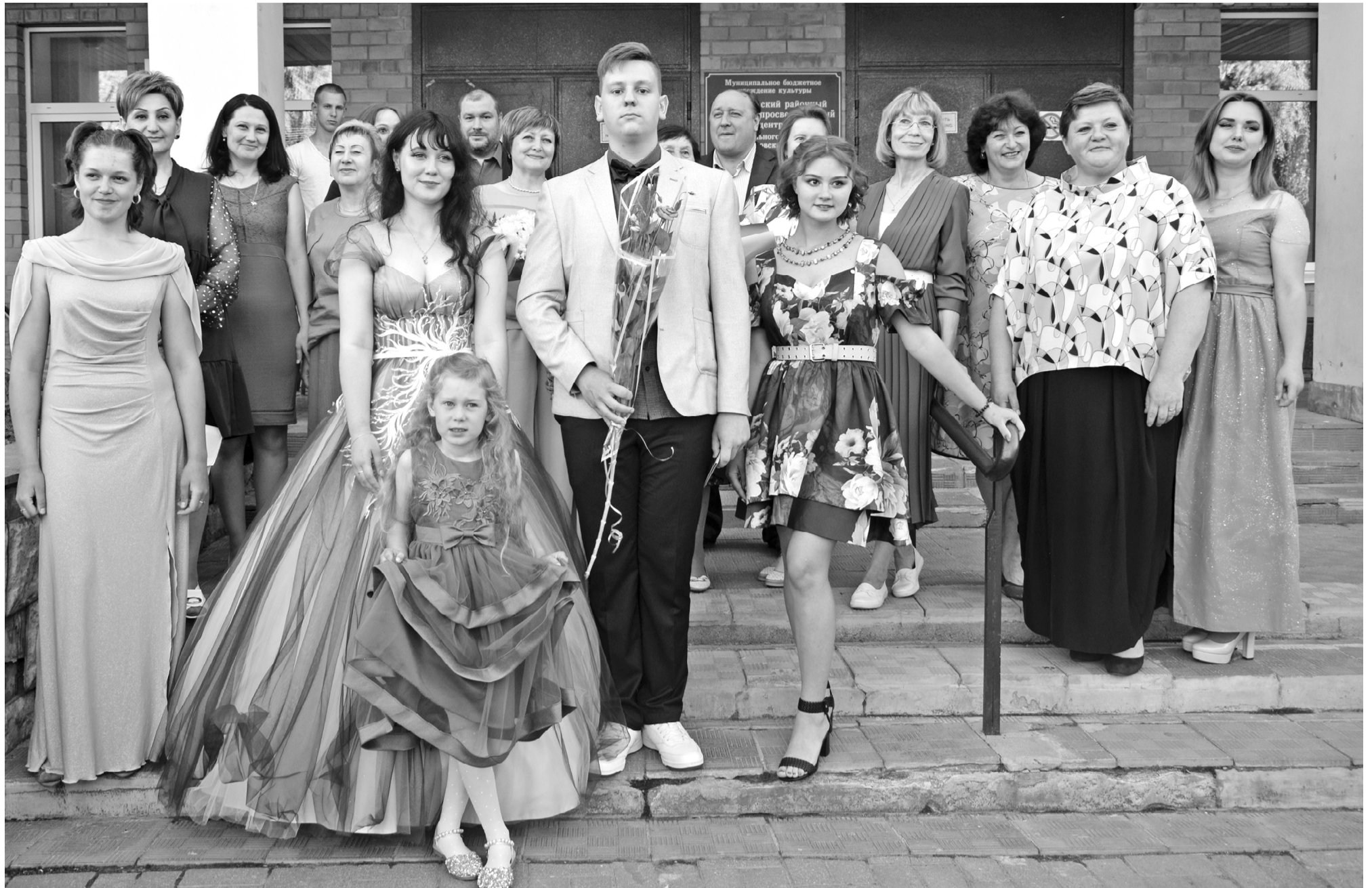
Позади поздравления и напутствия, все собираются на крыльце Глинковского Центра, чтоб сделать традиционное общее фото на память.