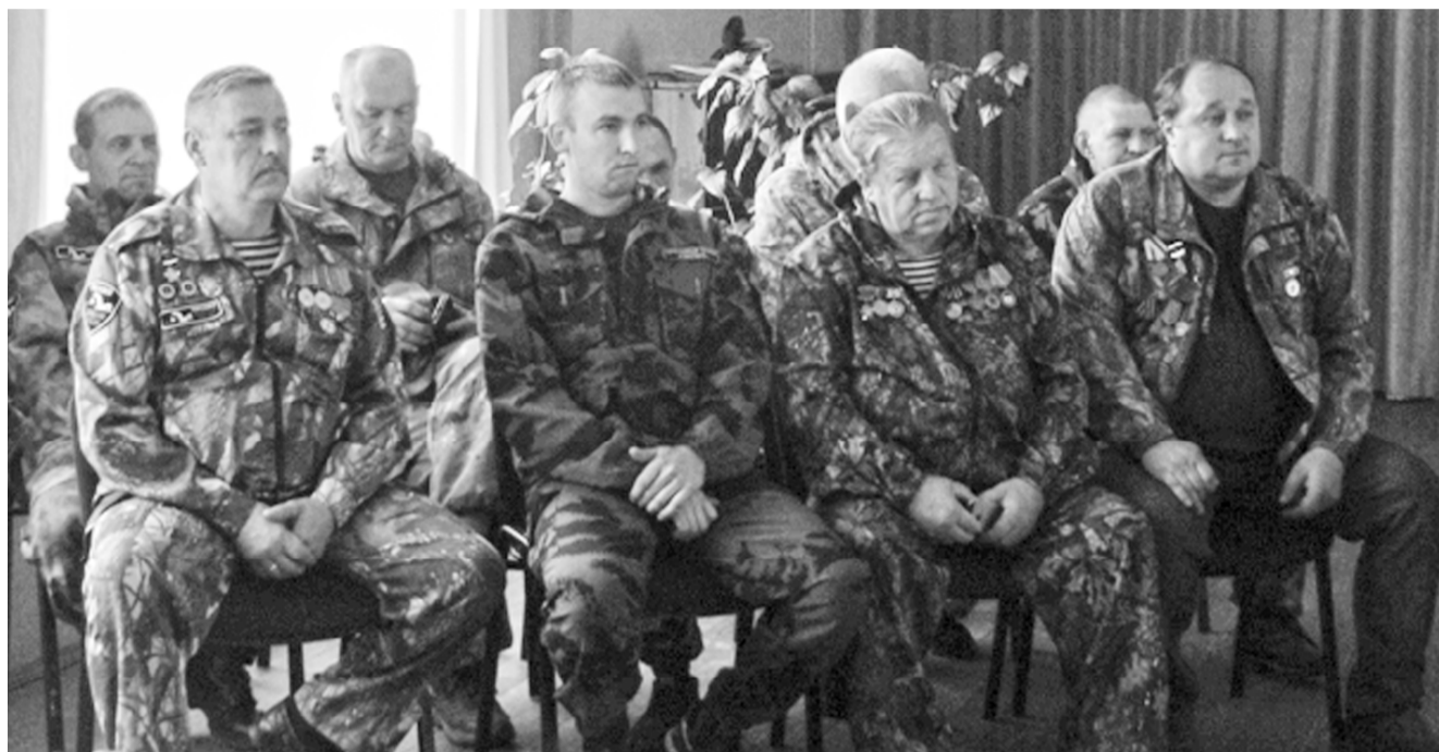
Бойцы поискового отряда «Гвардия» на юбилейной встрече.

Так уж сложилось, что дата создания глинковского поискового отряда пришлась на 22 июня – день начала Великой Отечественной войны.