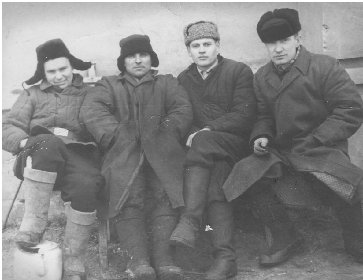
Работники Доброминской электростанции совхоза «Приднепровье».

фоновский ЭТУС (эксплуатационно-технический узел связи) в должности монтажера 3 разряда. В 60-х–70-х годах на территории области началась автоматизация телефонных сетей и радиодиффузия. Связисты телефонизировали сельсоветы, колхозы, совхозы, мастерские, фермы, объекты соцкультбыта и квартиры жителей деревень. В деревне Добромино был даже свой радиоузел. Жизнь стала невозможна без телефона.