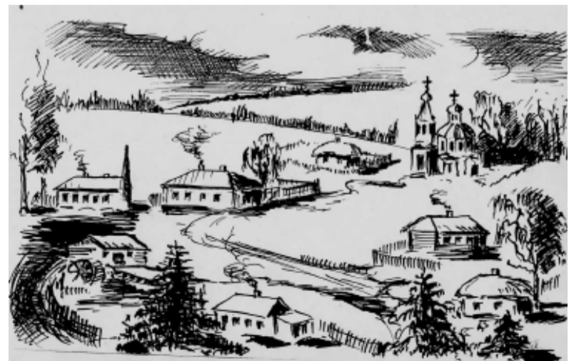
Так выглядела церковь села Ромоданова.