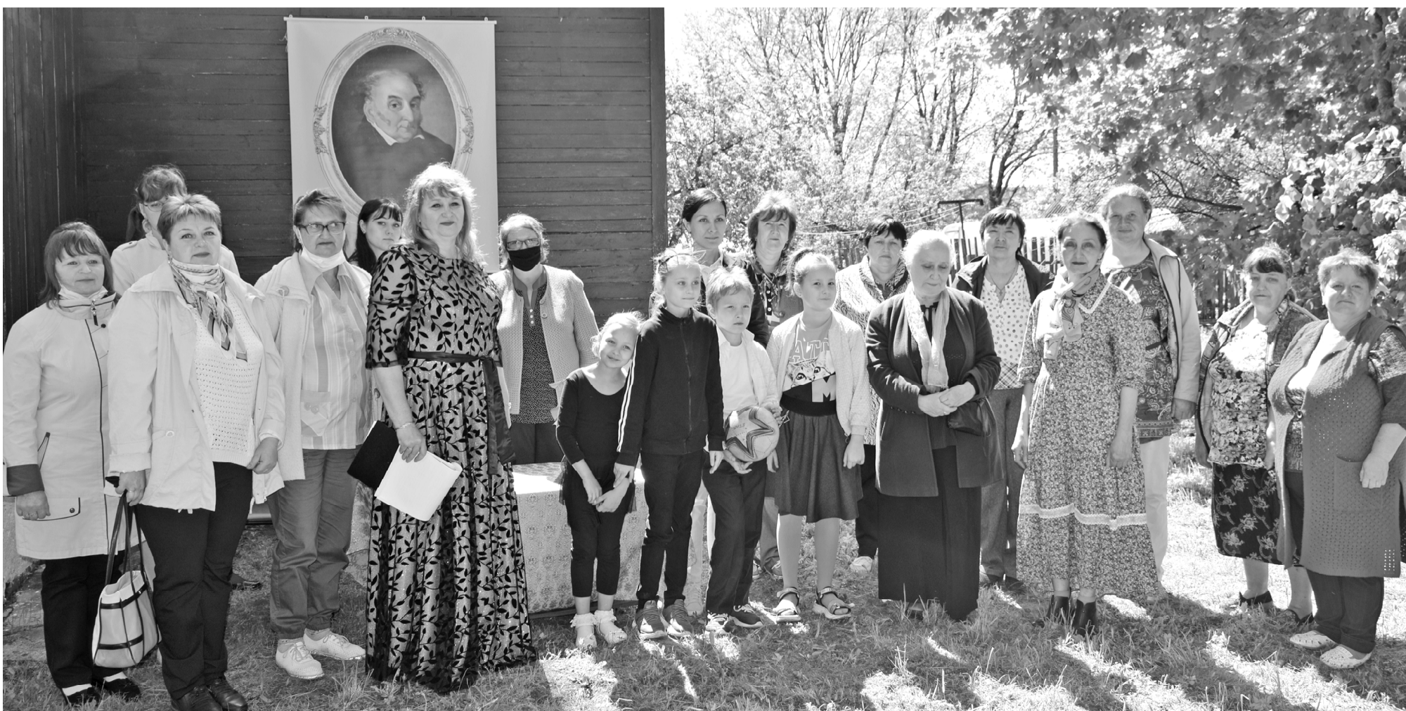
Участники заключительного мероприятия IV фестиваля творчества молодежи «... на Чердаке князя Шаховского» в деревне Беззаботы, на родине писателя.