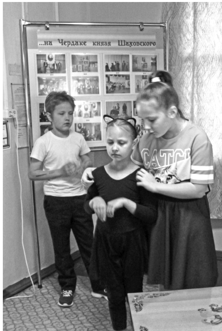
Сцена из спектакля «Брысь!»

В этом году, в Беззаботах, спектакль также был отыгран на одном дыхании. Прекрасная актерская игра не оставила публику равнодушной.