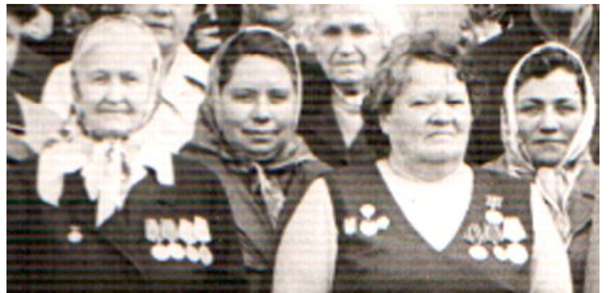
Встреча боевых подруг.