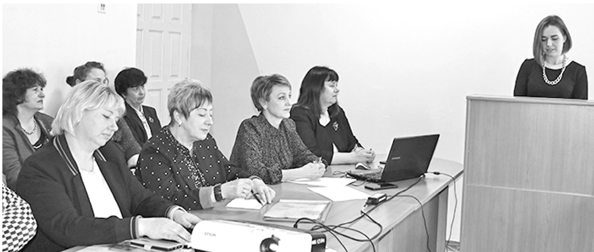
В ходе районного «круглого стола», посвященного Году педагога и наставника.