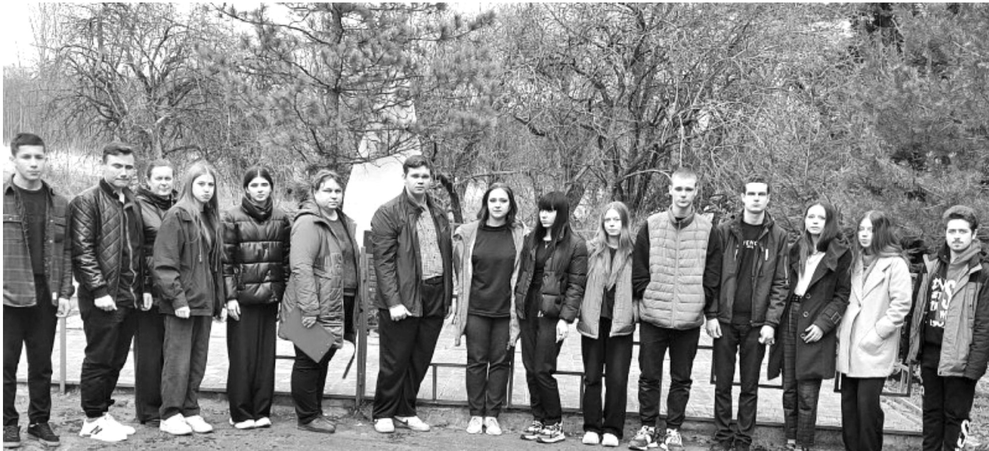
Во время выездной экскурсии Глинковского краеведческого музея в деревню Ляхово.

Сегодня особенно важно хранить память о прошлом, о тех трагедиях, которые происходили на нашей земле в годы Великой Отечественной войны. Поэтому особенно трепетно мы относимся к таким местам, как деревня Ляхово, трагическая история которой известна далеко за