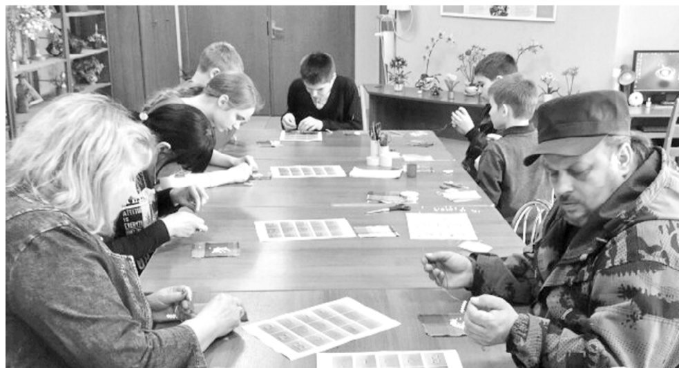
В Доме детского творчества в ходе мастер-класса.

Накануне самого значимого и самого любимого праздника – 9 мая, была запущена новая акция – «Талисман Победы».