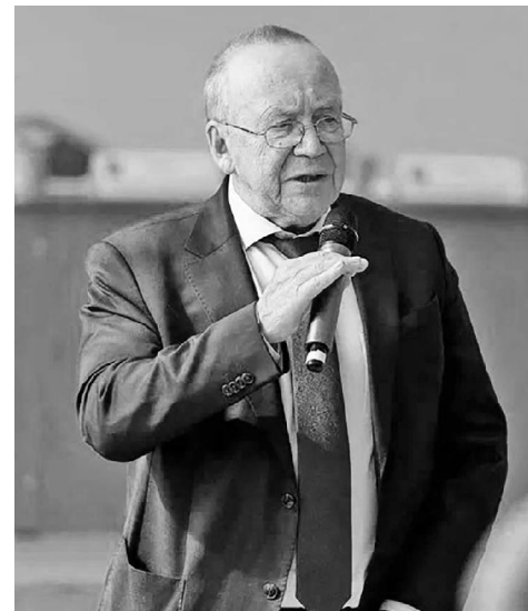
Юрий Павлович Вяземский.