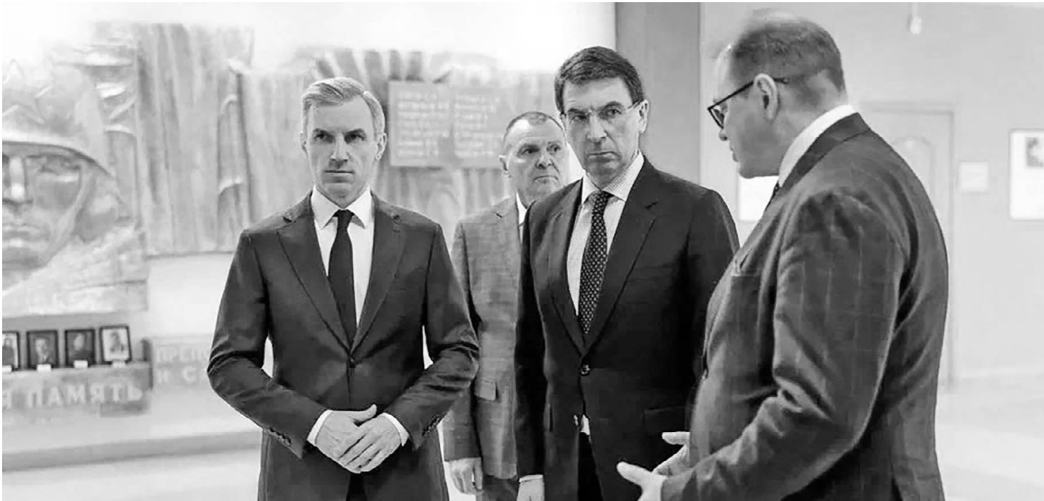
Губернатор В.Н. Анохин, полномочный представитель президента в ЦФО Игорь Олегович Щёголев.