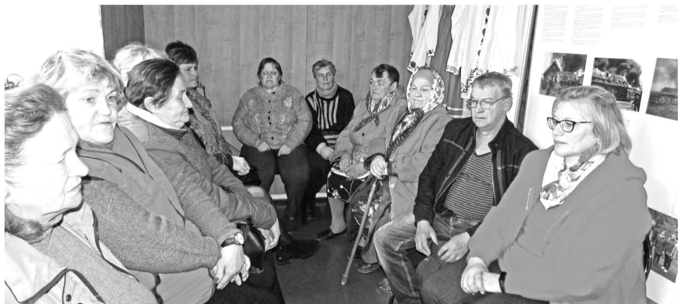
В Глинковском краеведческом музее.

еще пожелали крепкого здоровья, благополучия, оптимизма, любви и заботы близких.