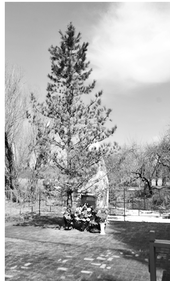
Памятник в деревне Ляхово.

В течение 1941-43 годов Смоленская область являлась местом ожесточенных боев с гитлеровскими захватчиками, в ходе которых родилась Советская гвардия.