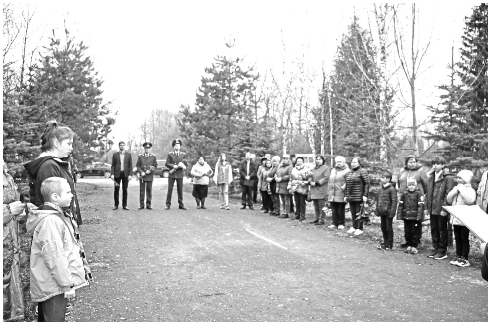
14 апреля 2023 года, деревня Ляхово Глинковского района, в день 81-й годовщины со дня трагедии.