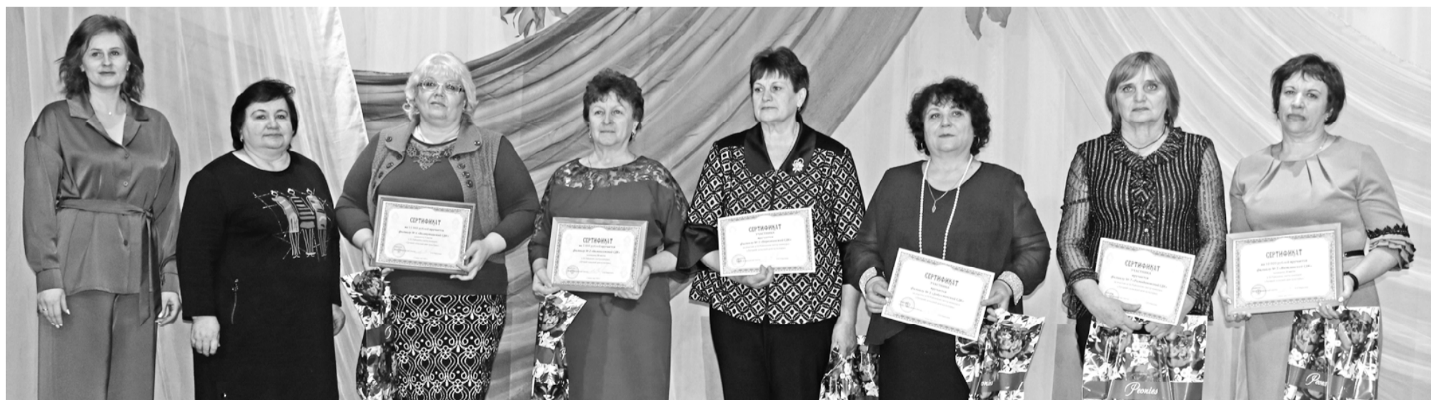
В момент подведения итогов конкурса «Лучший сельский Дом культуры».

Когда начинают говорить о работниках культуры, то сразу вспоминаются красочные веселые мероприятия, концерты, фестивали, агитбригады, различные торжественные церемонии. И кажется, что у культработников не работа, а сплошные праздники. Но за всеми этими праздниками стоит огромный труд. Сколько времени уходит на поиск материала, сколько репетиций, сколько бессонных ночей! И когда все проходит интересно, увлекательно, удивляешься выдумке этих людей, их неиссякаемой энергии и, конечно же, преданности своей профессии.