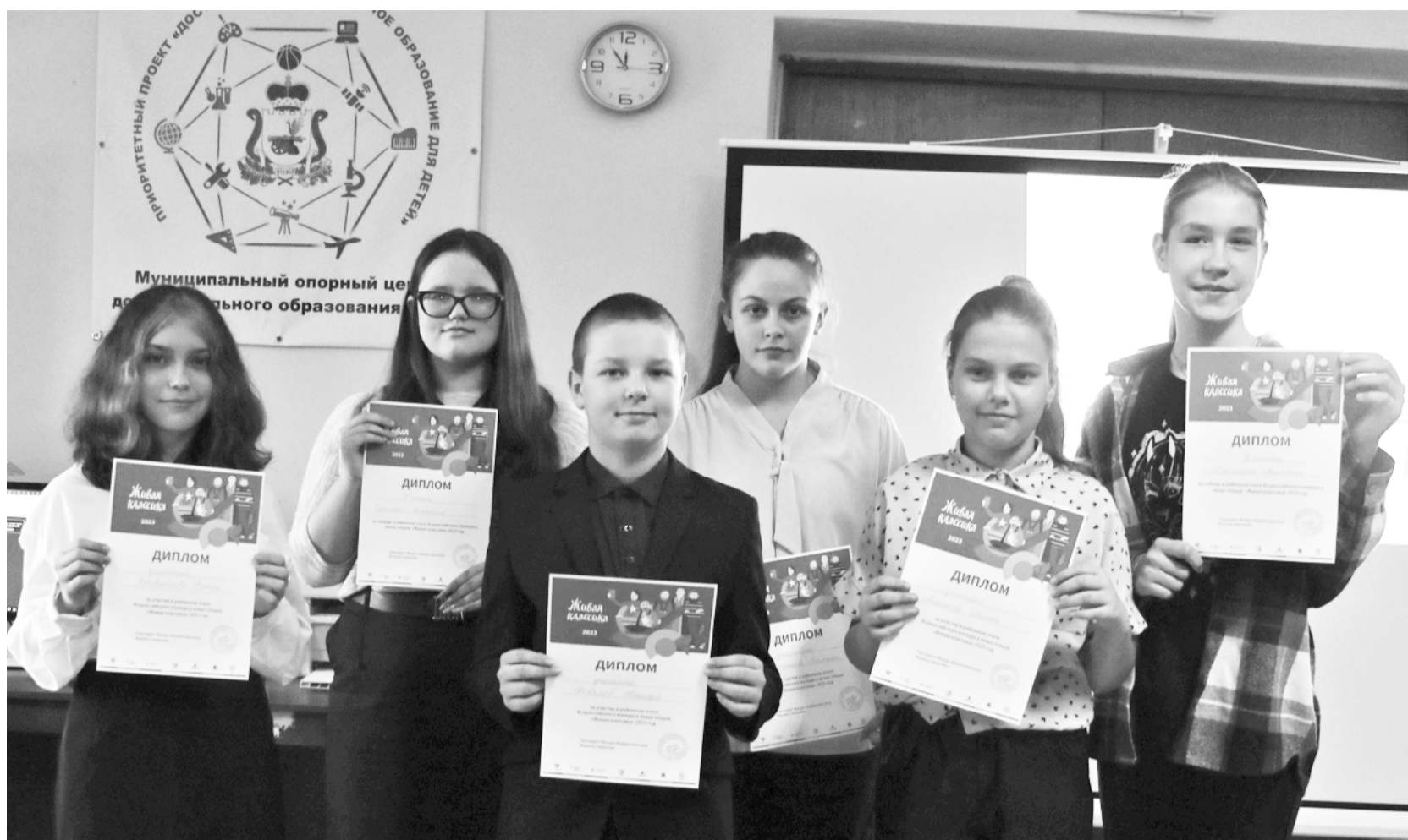
Участники и победители муниципального этапа конкурса «Живая классика».

Следует отметить, что произведения были выбраны в соответствии со