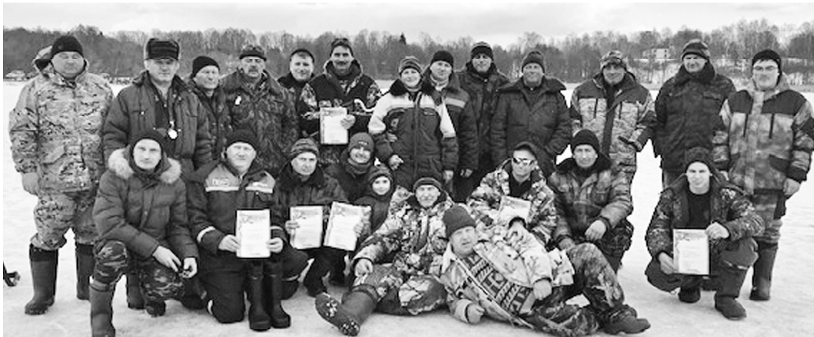
Рыболовы-любители, участники очередного районного конкурса по зимней ловле рыбы (март 2021 год).

Рыболова-зимника легко узнать по большому ящику и огромному ледобуру. Вот идет он по замерзшему водоему в теплом снаряжении, не боясь мороза и снега, идет не ради нескольких рыбешек, а ради неповторимых часов, которые можно провести у заветной лунки. В такие минуты поднимается настроение, а если клюет, то душа, что называется, поет от счастья.