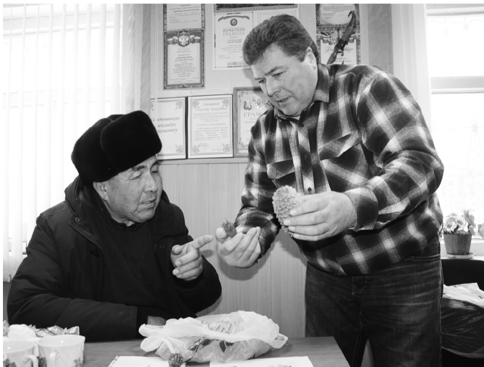
Семена глинковских елочек и сосен отправятся на Родину героя.