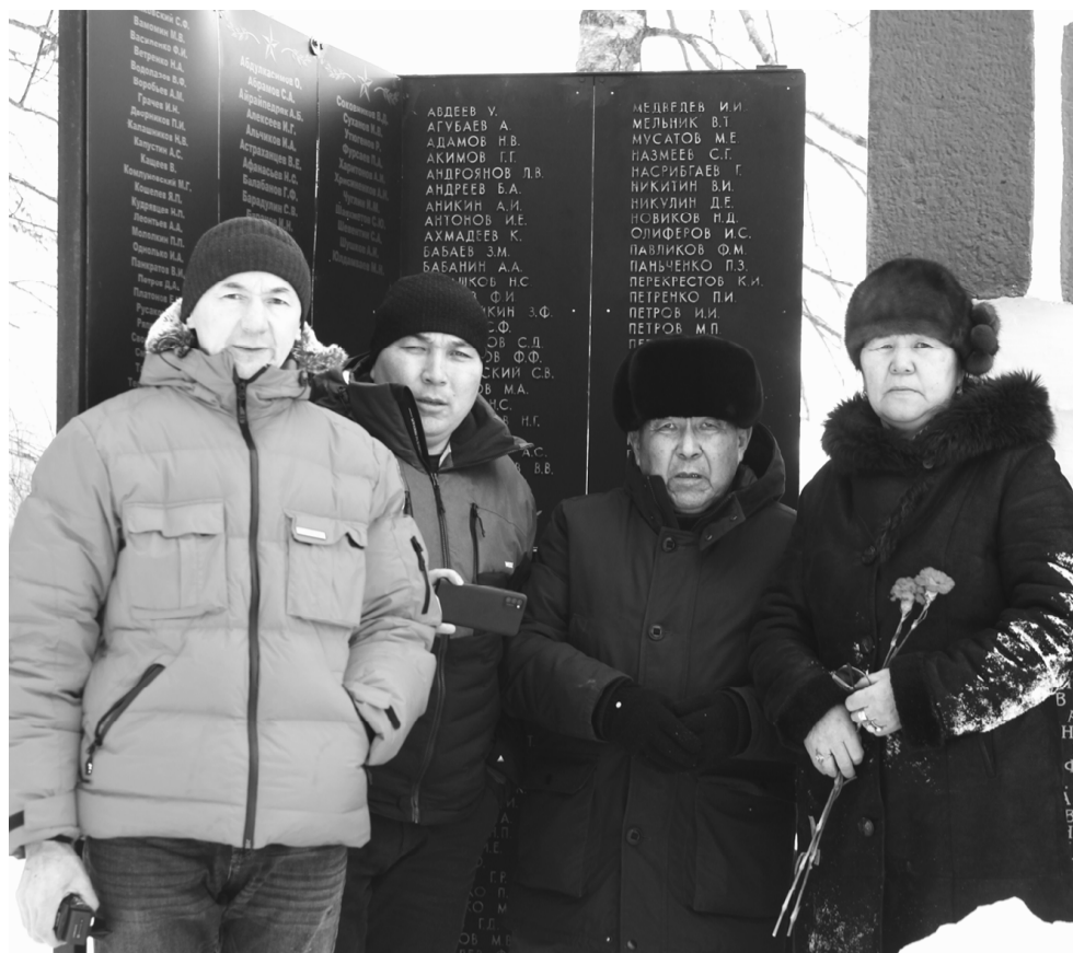
Семья Бекových у братской могилы в селе Глинка (2021 год).