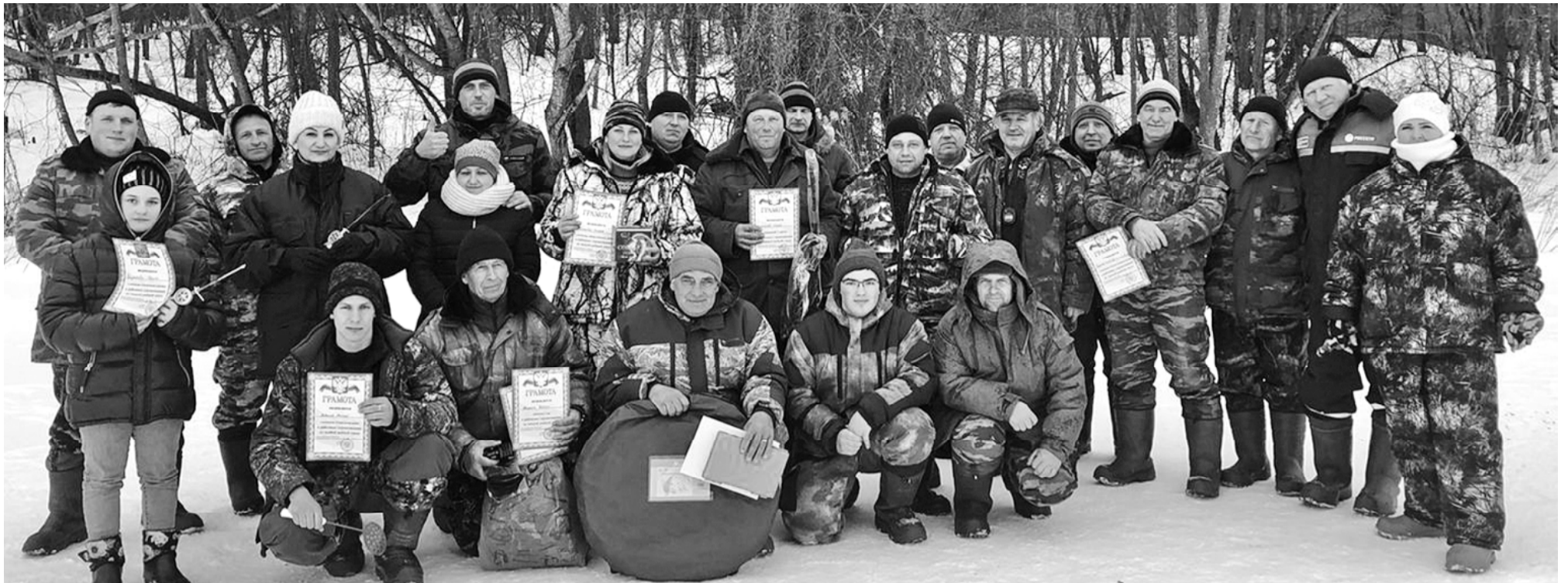
Участники Глинковских районных соревнований по зимней рыбной ловле, март 2022 года, деревня Беззаботы.

Сколько народных поговорок и пословиц сложено про рыбалку. Одну из них, про то, что «без терпенья нет уженья» мы вынесли в заголовок этого материала. И еще одну по этому поводу вспомнить можно - «Женщина, которая никогда не видела своего мужа за ужением рыбы, не имеет понятия, за какого терпеливого человека она вышла замуж».