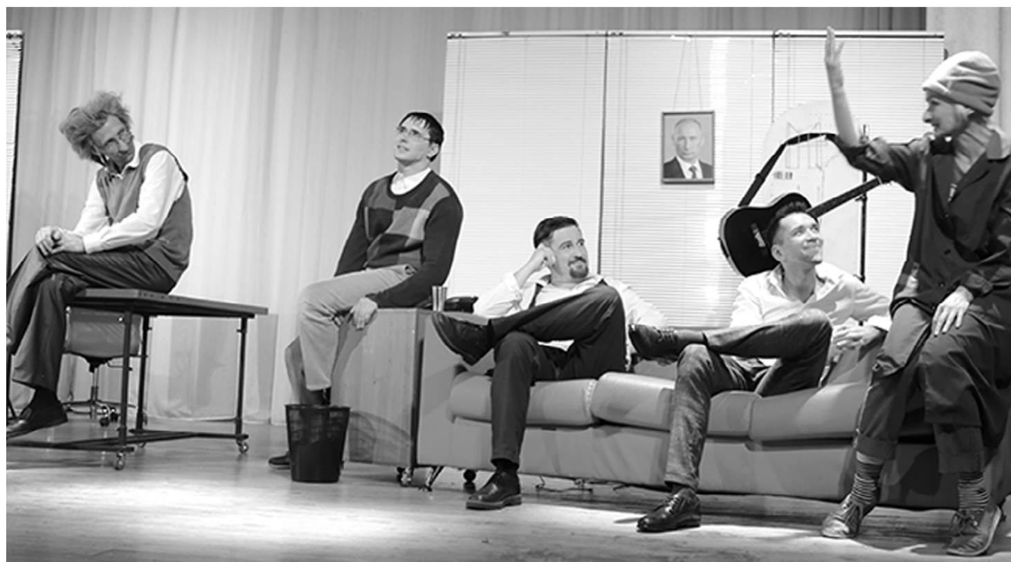
Сцена из спектакля Смоленского Камерного театра «Корпоратив».