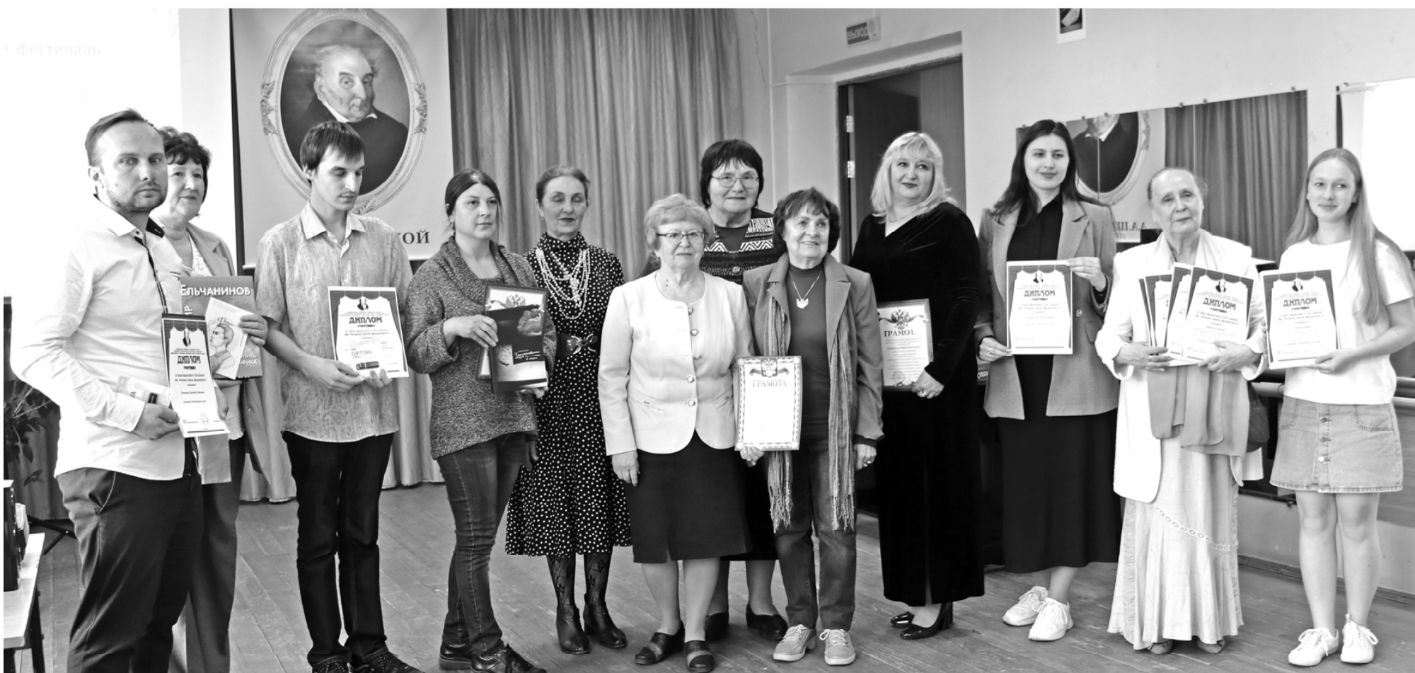
Участники VI многожанрового фестиваля «На Чердаке у князя Шаховского».