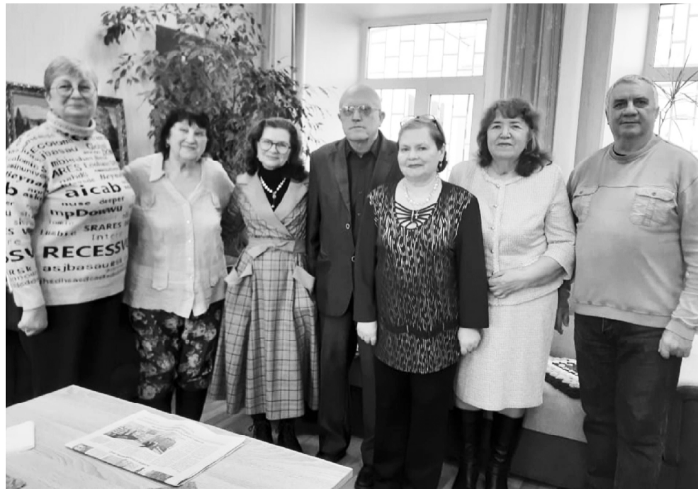
Участники встречи в Клубе золотого возраста города Ельни.

В День памяти Блаженной Ксении Петербургской в клубе «Золотого возраста» города Ельни состоялась еще одна встреча друзей, посвящённая творчеству великих русских поэтов 19 века Афанасия Фета и Федора Тютчева.