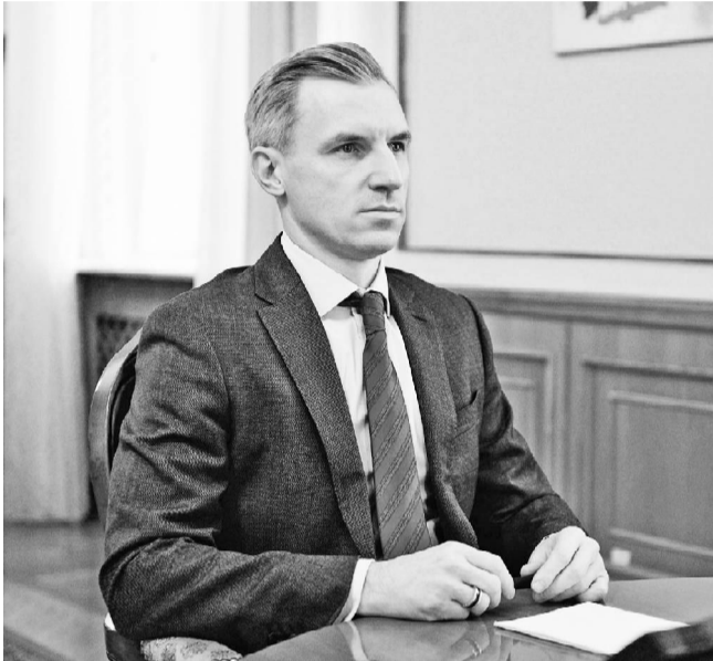
Губернатор Смоленской области Василий Анохин после завершения прямой линии президента Российской Федерации Владимира Путина заявил: «Все поручения и задачи, поставленные главой государства, будут оперативно выполнены».

По итогам важного мероприятия глава региона выделил главное для Смоленской области.