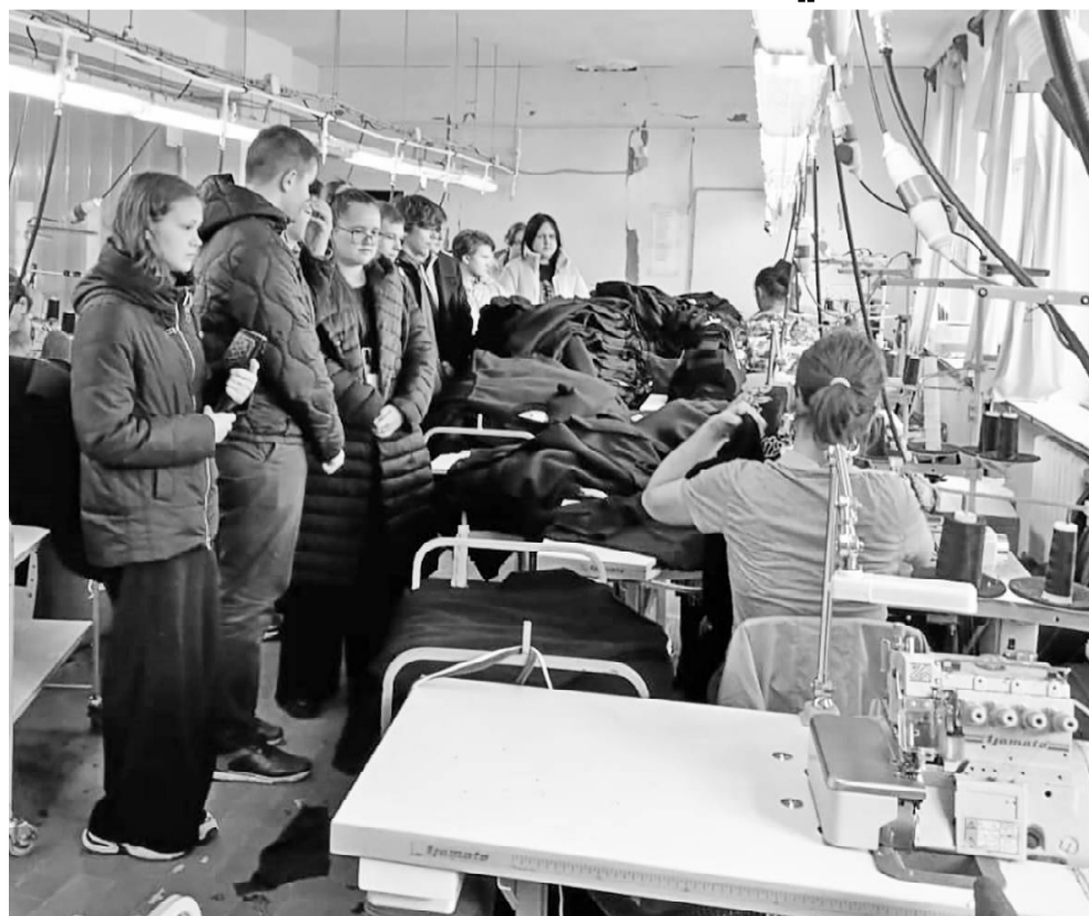
Болтутинские школьники в ходе экскурсии на глинковском производственном участке ООО «Шарм».