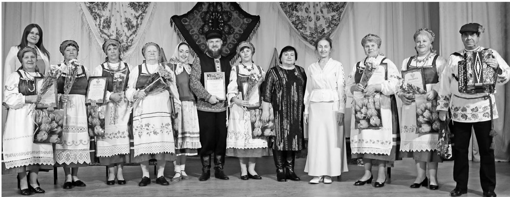
На сцене Глинковского Центра участники юбилейной программы, посвященной 35-летию народного коллектива фольклорного ансамбля «Венчик».