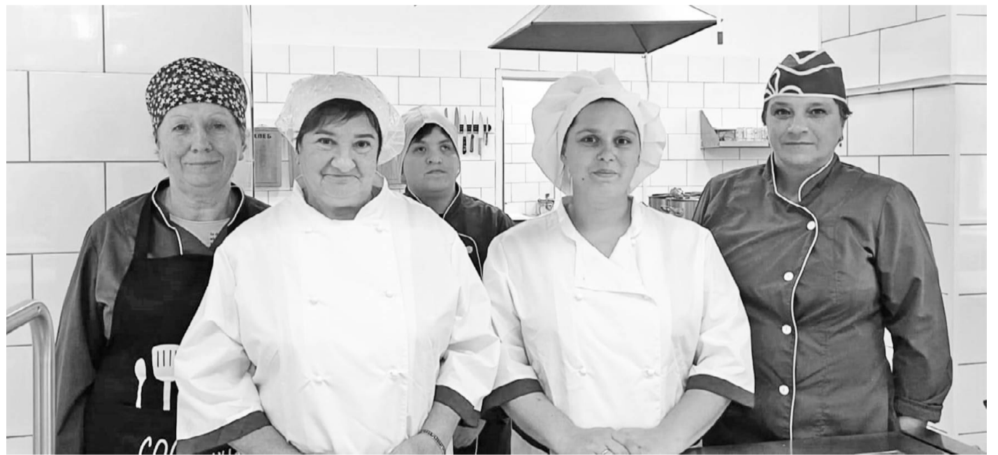
Коллектив столовой Глинковской средней школы, победитель регионального этапа Всероссийского конкурса «Лучшая школьная столовая».

В Смоленской области, в рамках регионального этапа Всероссийского конкурса «Лучшая школьная столовая», в 2024 году проводился конкурс школьных столовых. Он был организован в целях совершенствования организации питания обучающихся, внедрения инновационных технологий кулинарной продукции, современных форм и методов предоставления качественного и сбалансированного питания, распространения лучшего опыта работы, популяризации принципов здорового питания в общеобразовательных организациях.