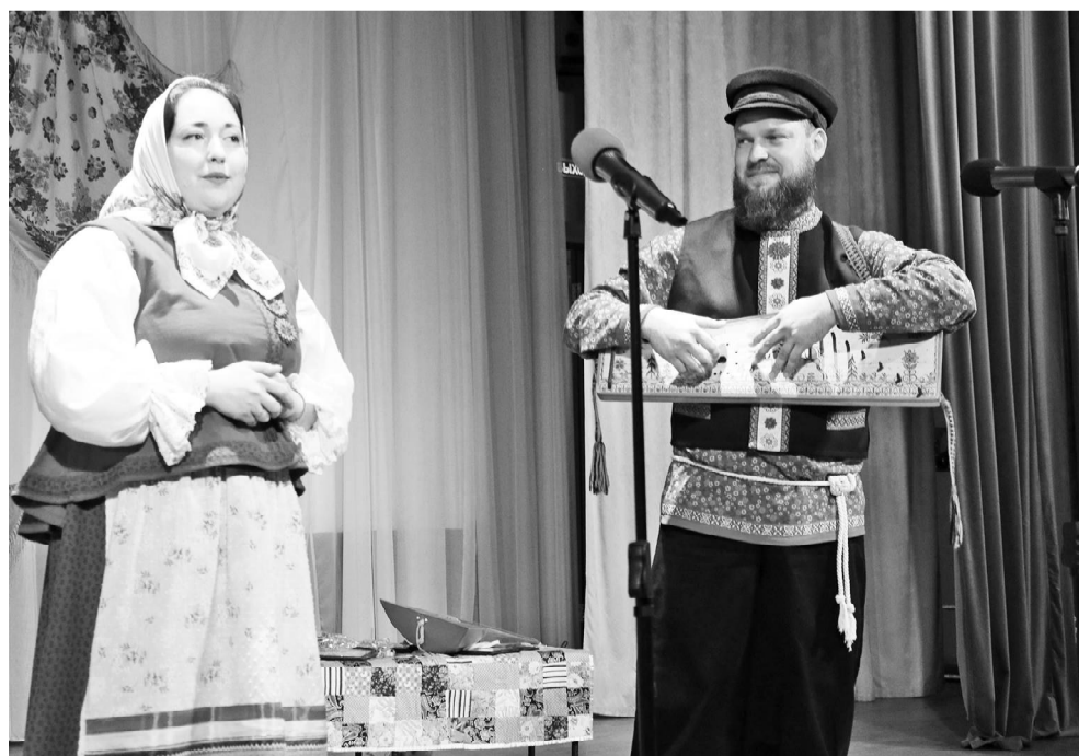
На глинковской сцене, покоривший зрителей, семейный дуэт «СмоРОДИНА».