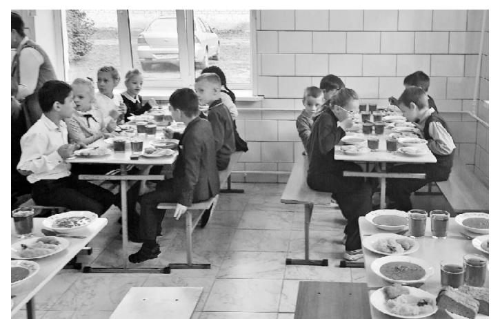
В столовой Глинковской школы.