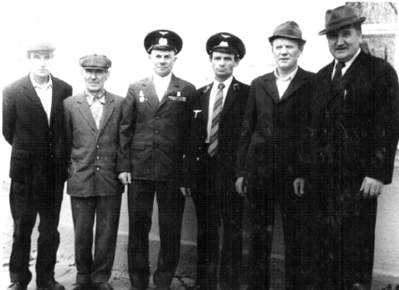
Станция Глинка, 1982 год.

Затем их перебросили в Восточный Казахстан строить железные дороги. Усть-Каменогорск-Зырянск. Условия были тяжелые, горы, скалы, работали по 12 часов, жили в палатках по 60 человек (топилось 2 печки-буржуйки). Но все были молоды, трудности переносились стойко, коллектив был дружный, сплоченный, никакой «дедовщины» не было.